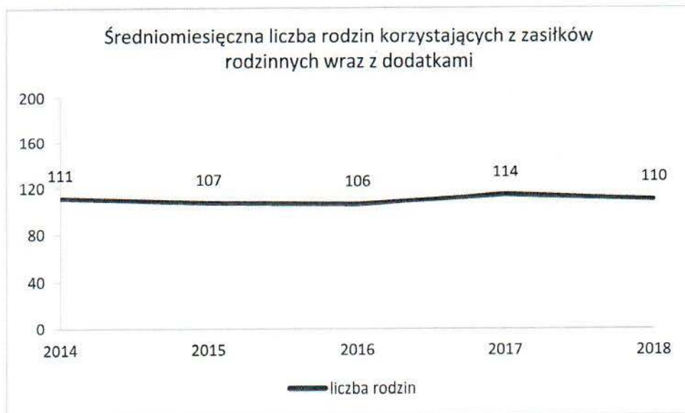
Wykres nr 2