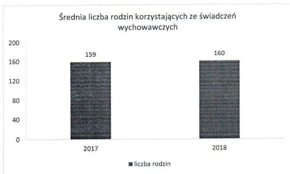
Wykres nr 1